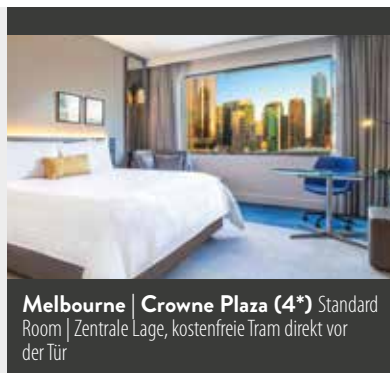
Melbourne | Crowne Plaza (4*) Standard Room | Zentrale Lage, kostenfreie Tram direkt vor der Tür