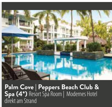
Palm Cove | Peppers Beach Club & Spa (4*) Resort Spa Room | Modernes Hotel direkt am Strand