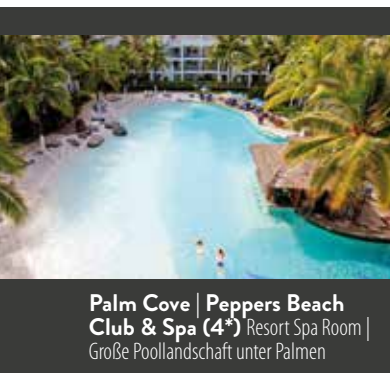
Palm Cove | Peppers Beach Club & Spa (4*) Resort Spa Room | Große Poollandschaft unter Palmen

10. TAG DARWIN – KAKADU | Früh geht es in Richtung Kakadu Nationalpark, dem Naturparadies unter UNESCO-Schutz. Hier in Australiens größtem Nationalpark erwarten Sie steile Felswände, ein üppiger Regenwald und Felskunstgalerien, die bis zu 50.000 Jahre alt sind. Bei der unerhaltsamen Bootsfahrt auf dem Yellow Water Billabong kann eine Vielzahl an Vogelarten – darunter fünf Eisvogelarten – und mit Glück mächtige Krokodile beobachtet werden. (F/M/A)