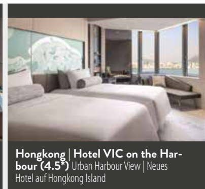
Hongkong | Hotel VIC on the Harbour (4.5*) Urban Harbour View | Neues Hotel auf Hongkong Island