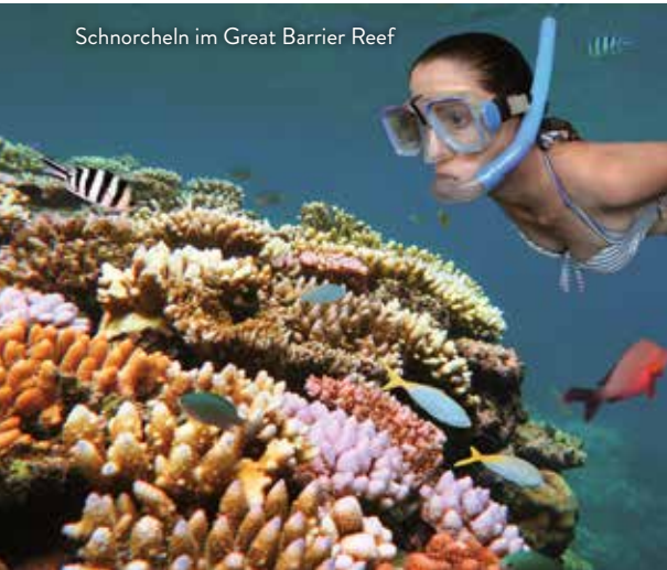
Schnorcheln im Great Barrier Reef