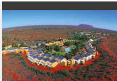
Ayers Rock | Voyages Outback Pioneer Hotel (3.5*) Standard Room | Geräumige Zimmer im roten Zentrum