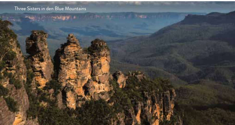
Three Sisters in den Blue Mountains