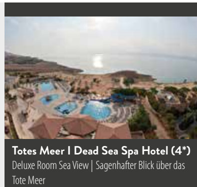
Totes Meer | Dead Sea Spa Hotel (4*) Deluxe Room Sea View | Sagenhafter Blick über das Tote Meer