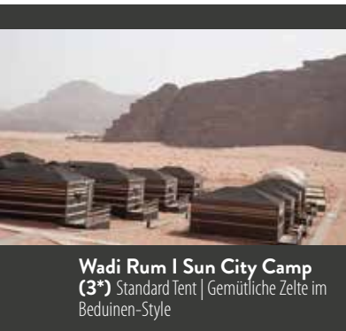
Wadi Rum | Sun City Camp (3*) Standard Tent | Gemütliche Zelte im Beduinen-Style

5. TAG PETRA | Petra ist der wertvollste Schatz Jordaniens. Die Nabatäer schlugen diese riesige Stadt vor mehr als 2.000 Jahren in die Sandsteinwände. Der einzige Weg in die Stadt hinein führt durch den Siq, einen schmalen Gebirgspfad von fast zwei Kilometern Länge, der auf beiden Seiten von bis zu 80 m hohen Felsen umgeben ist – schon dieser Spaziergang ist ein einzigartiges Erlebnis. Am Ende des Siq erhaschen Sie durch einen schmalen Spalt einen ersten Blick auf das Schatzhaus. Die massive Fassade, die aus einem dunkelrosafarbenen Gesteinsabhang geschlagen wurde, stellt alles um sich herum in den Schatten! Das Schatzhaus ist aber nur das erste der vielen Wunder von Petra. Es gibt hunderte feiner, aus dem Fels geschlagener Gräber mit aufwändigen Inschriften, die Sie bei einem ausführlichen Spaziergang über das riesige Gelände entdecken. Durch den Siq führt der Weg wieder hinaus – wer mag, nimmt für den Rückweg die Pferde-Kutsche. Am Abend erleben Sie