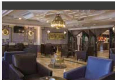
Amman | Toledo Amman Hotel (3*) Standard Room | Im Herzen der Stadt, am Rand der alten Stadtmitte