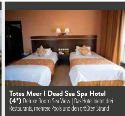
Totes Meer | Dead Sea Spa Hotel (4*) Deluxe Room Sea View | Das Hotel bietet drei Restaurants, mehrere Pools und den größten Strand