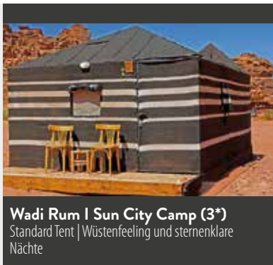
Wadi Rum | Sun City Camp (3*) Standard Tent | Wüstenfeeling und sternenklare Nächte