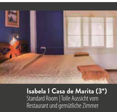
Isabela | Casa de Marita (3*) Standard Room | Tolle Aussicht vom Restaurant und gemütliche Zimmer

7. TAG SANTA CRUZ – ISABELA | Mit dem öffentlichen Schnellboot geht es auf die Nachbarinsel Isabela. Hier besuchen Sie zunächst das Schildkrötenaufzuchtzentrum. Der Weg führt an kleinen Lagunen vorbei, in denen sich zeitweise Flamingos und Bahamaenten aufhalten. Interessant auch die Vegetation: Manchinelbäume, Mangroven und Kakteen. Nach einer kurzen Bootsfahrt erreichen sie die kleine Felseninsel Las Tintoreras – Hauptnistplatz von Meerleguanen. In einem Lavakanal tum-