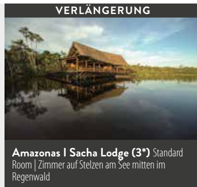
Amazonas | Sacha Lodge (3*) Standard Room | Zimmer auf Stelzen am See mitten im Regenwald