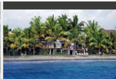
Isabela | Casa de Marita (3*) Standard Room | Wunderbare Lage direkt am Meer