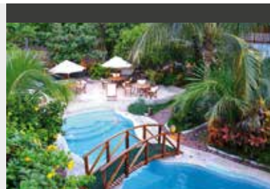
Santa Cruz | Hotel Silberstein (3*) Standard Room | In der Nähe des Hafens und der Shoppingmöglichkeiten