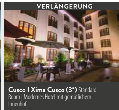
Cusco | Xima Cusco (3*) Standard Room | Modernes Hotel mit gemütlichem Innenhof