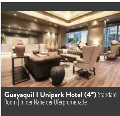
Guayaquil | Unipark Hotel (4*) Standard Room | In der Nähe der Uferpromenade