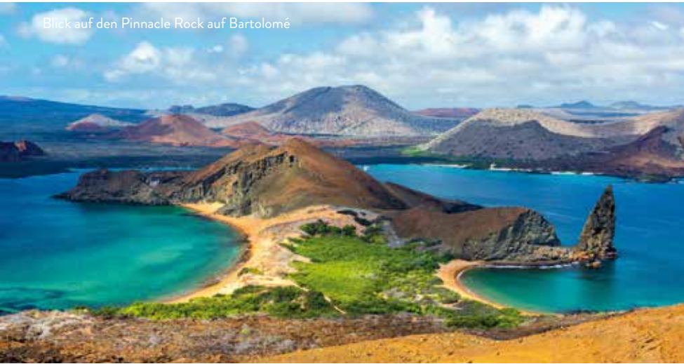
Blick auf den Pinnacle Rock auf Bartolomé