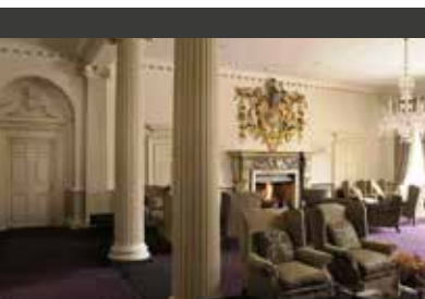
Essex | Buxted Park Hotel (4*) Standard Room | Traditionsbewußt mit hervorragendem Service

3. TAG SUSSEX | Nach einem ausgiebigen Frühstück widmen Sie sich der britischen Gartenkunst. Zunächst besuchen Sie Great Dixter House & Gardens unweit der Südküste. Das Haus im Tudor-Stil stammt aus dem 15. Jahrhundert, sein Garten wurde vor rund 100 Jahren im Stil der Arts and Crafts-Bewegung umgestaltet: Statt eintöniger Beet-Teppiche bietet der weitläufige Garten verschiedene Einzelräume unterschiedlichen Charakters. Nach dem Besuch von Great Dixter fahren Sie nach Sissinghurst Garden, hier haben Sie auch Zeit für eine Mittagspause – vielleicht gönnen Sie sich Cream Tea: Scones, Clotted Cream und Erdbeermarmelade, ein typisch britischer Genuss. Anschließend schlendern Sie durch das Kleinod, das in den dreißiger Jahren von