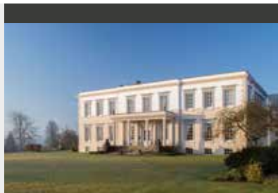
Essex | Buxted Park Hotel (4*) Classic Double Room | Historische Anlage in typisch englischer Parklandschaft