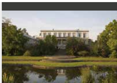
Essex | Buxted Park Hotel (4*) Classic Double Room | Historisches Herrenhaus aus dem 18. Jahrhundert