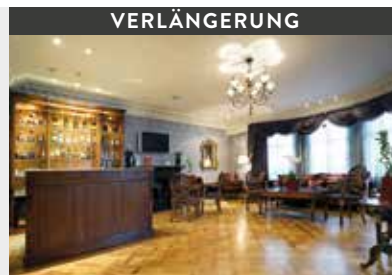
London | Ashburn Hotel (4*) Superior Double Room | Kleines aber feines Boutique-Hotel im Herzen der Metropole