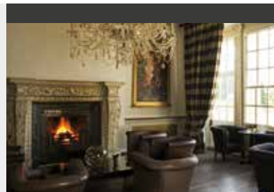
Essex | Buxted Park Hotel (4*) Classic Double Room | Gemütliche Bar mit Kamin