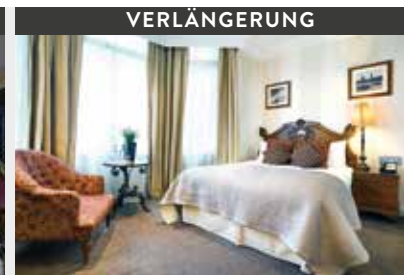
London | Ashburn Hotel (4*) Superior Double Room | Gemütlich und stilvoll „britisch“ sind auch die geräumigen Zimmer