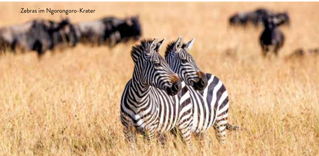
Zebbras im Ngorongoro-Krater