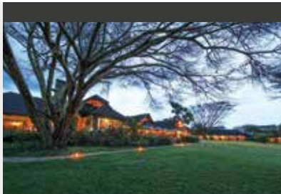
Masai Mara | Keekorok Lodge (4*) Standard Room | Nilpferde am hauseigenen Wasserloch