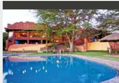
Serengeti | Serengeti Soda Lodge (3.5*) Standard Room | Große Zimmer mit Blick über die Serengeti