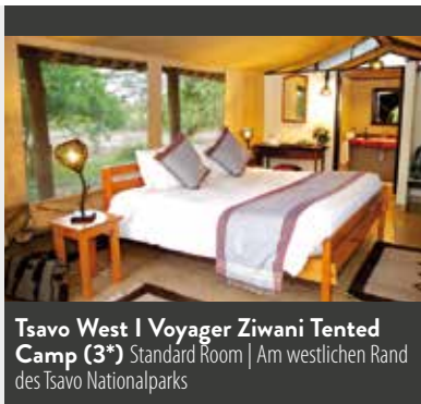
Tsavo West | Voyager Ziwani Tented Camp (3*) Standard Room | Am westlichen Rand des Tsavo Nationalparks