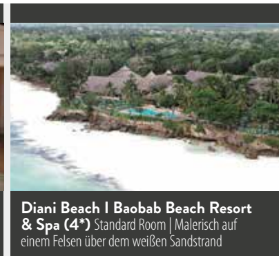
Diani Beach | Baobab Beach Resort & Spa (4*) Standard Room | Malerisch auf einem Felsen über dem weißen Sandstrand