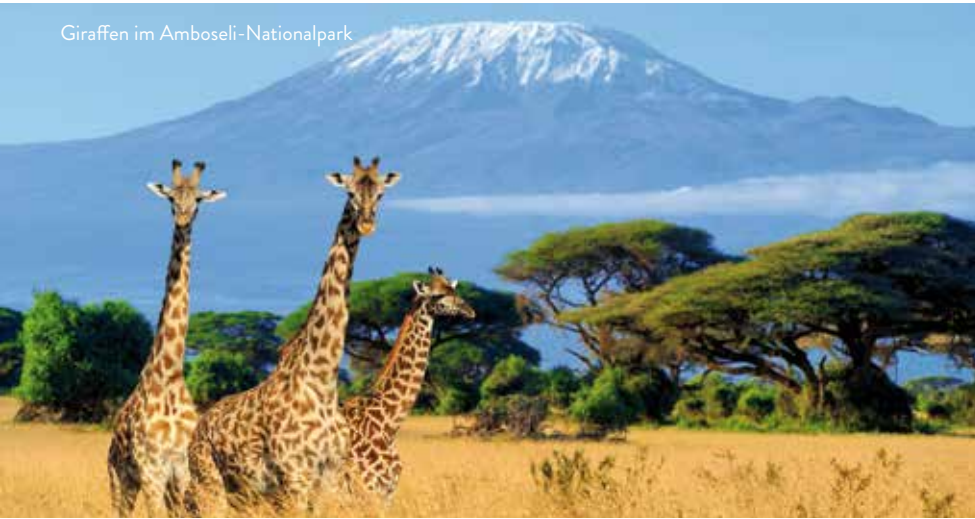
Giraffen im Amboseli-Nationalpark