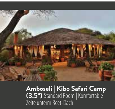
Amboseli | Kibo Safari Camp (3.5*) Standard Room | Komfortable Zelte unterm Reet-Dach

Jeder der besuchten Nationalparks hat seine Besonderheiten. Hier im Amboseli ist es nicht nur der Kilomandscharo, der eine fantastische Kulisse bei der Tierbeobachtung darstellt. Es sind auch die großen Elefantenherden, die durch teilweise sumpfiges Gelände ziehen – von Kuhreihern umschwärmt, die auf die Insekten und Amphibien aus sind, die von den Elefanten aufgeschreckt