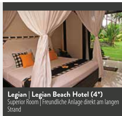
Legian | Legian Beach Hotel (4*) Superior Room | Freundliche Anlage direkt am langen Strand