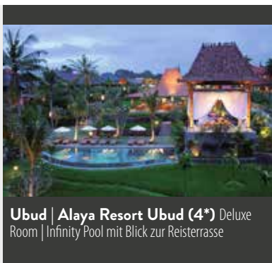
Ubud | Alaya Resort Ubud (4*) Deluxe Room | Infinity Pool mit Blick zur Reisterrasse