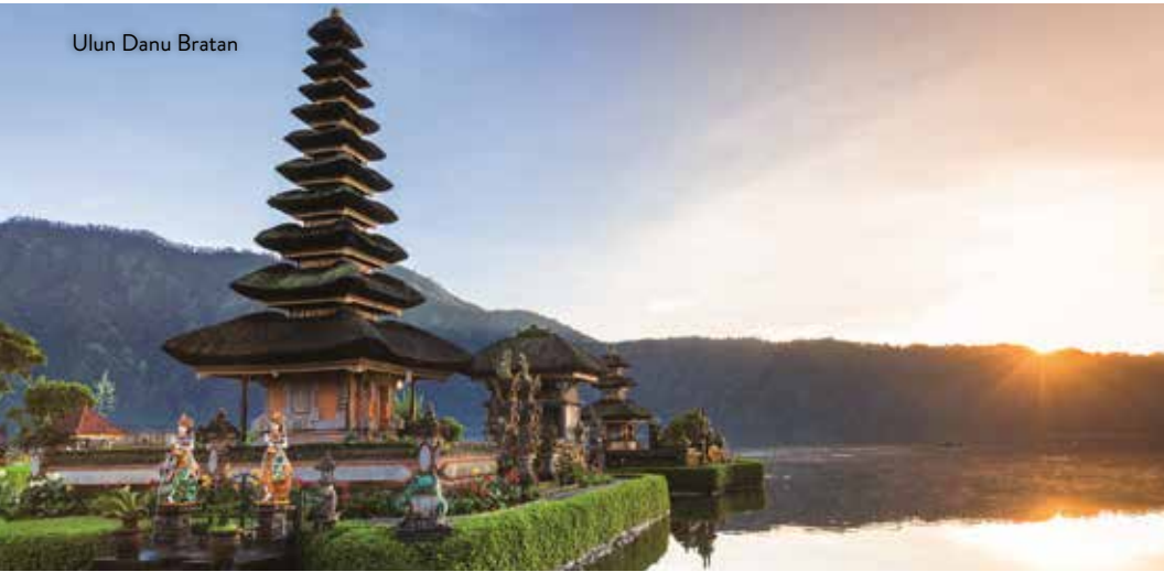
Ulun Danu Bratan