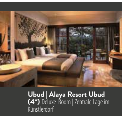
Ubud | Alaya Resort Ubud (4*) Deluxe Room | Zentrale Lage im Künstlerdorf

6. TAG CANDIDASA – UBUD | Nach dem Frühstück erkunden Sie das Inselinnere. Erstes Ziel des Tages ist der Besakih-Tempel, auch Muttertempel genannt. Die mehrstufigen und eindrucksvollen Pagoden liegen an einem Hang und bieten mit den grünen Bergen im Hintergrund beste Fotomotive. Auf dem weiteren Weg halten Sie an einem Aussichtspunkt, von dem aus Sie den Lake Batur gut im Blick haben – tiefblaues Wasser, umgeben von einer Bergkette: Einfach wunderschön! Und einen weiteren Tempel besuchen Sie heute: Inmitten der herrlich grünen Landschaft befindet sich das