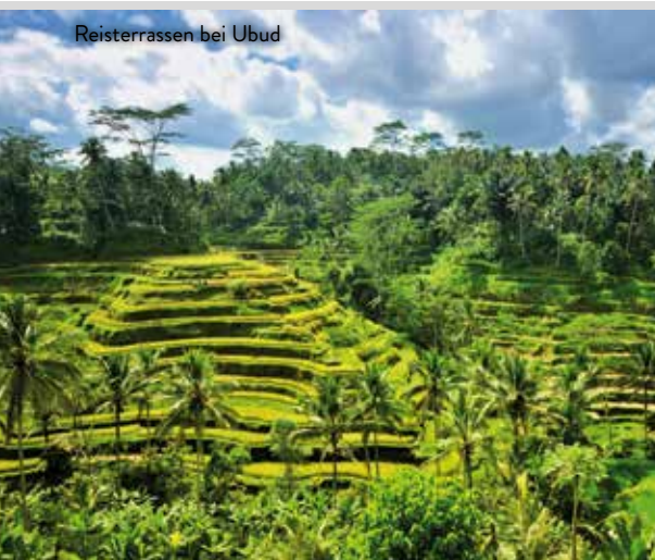
Reisterrassen bei Ubud