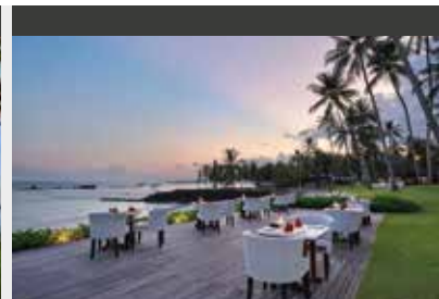
Candidasa | Candi Beach Resort & Spa (4*) Deluxe Garden Room | Dinner mit Meerblick