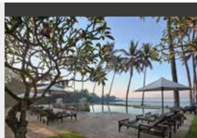
Candidasa | Candi Beach Resort & Spa (4*) Deluxe Garden Room | Schöner Pool in großem Garten