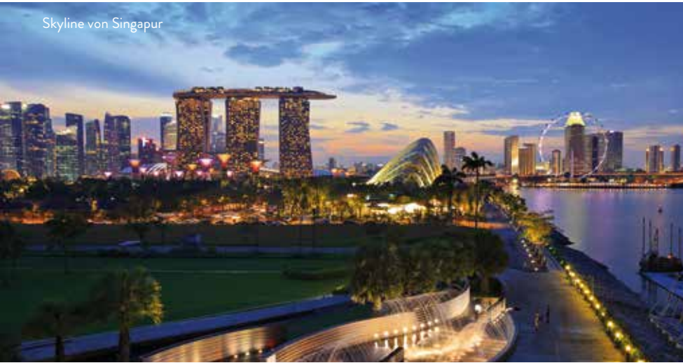
Skyline von Singapur